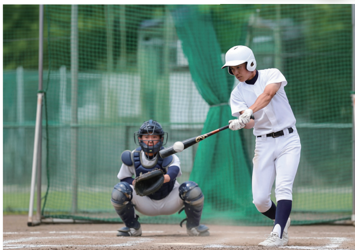
▲ 活発なクラブ活動

わせがくPURE高校は、創立70年の伝統を持つ大学受験の名門「早稲田予備校」を運営する早稲田学園により設立する広域通信制高校で、2026年4月に開校しました。茨城県常総市に本校を置き、水戸、古河、守谷のほか、群馬県、東京都にキャンパスがあります。姉妹校の「わせがく高校」と「わせがく夢育高校」は、合わせて1万人を超える卒業生を輩出しています。姉妹校の実績を引き継ぎ、生徒が自立して生活できるように、人としての基礎基本(各教科の基礎学力・基本的生活習慣・人間性・社会性等)を身につけ、生徒一人ひとりの夢と一緒に育みます。