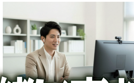
オンラインホームルーム