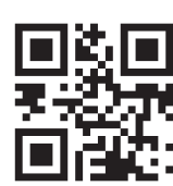
各会場の動画が 見られます