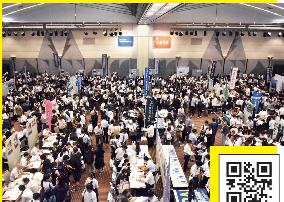
昨年幕張メッセで開かれた 首都圏進学フェア

来春の高校入試を目指す受験生を中心に、学校選びの重要な指針となる「首都圏進学フェア2026 in 千葉」が7~9月、今年もメイン会場の幕張メッセなど、県内4会場で開かれます。県内の高校を中心とした学校がブースを設け、来春の入試資料を配布。個別面談方式で受験生の相談に応じます。夏休み中に進学フェアの会場を訪れ、最新の入試情報をしっかり把握して自分にあった学校選びをしましょう。